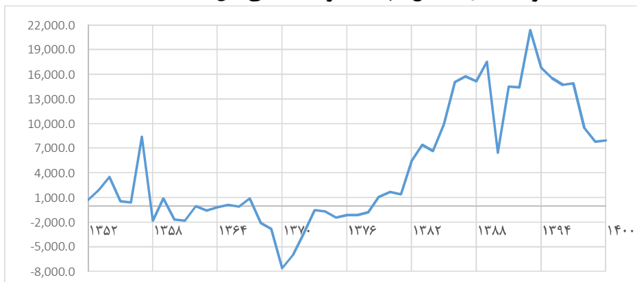
نمودار ۱- روند ارزش قاچاق (میلیون دلار) طی سال‌های ۱۳۵۲-۱۴۰۰